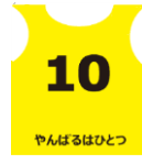
安全管理スタッフ